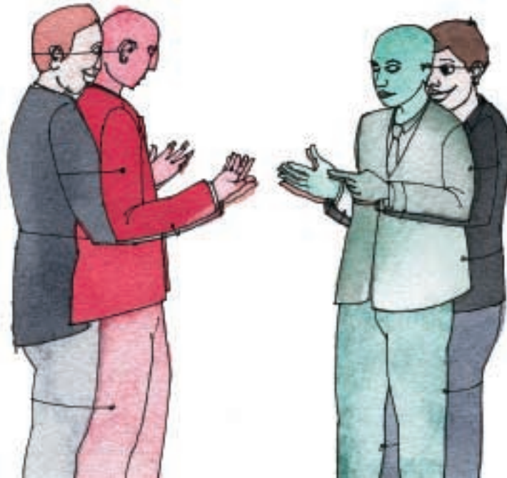
Die Organisationsaufstellung macht Interdependenzen sichtbar.

Diese zweite Konstellation weckte bei den «Führungskräften» den Impuls, näher an die «Operativen Routinen» heranzutreten. Die «Projekte» wurden darauf so platziert, dass sie die «Operativen Routinen» ins Blickfeld nehmen konnten. Nun standen die Repräsentanten in einem Verhältnis zueinander, das von allen als stimmig und richtig wahrgenommen wurde (siehe Abbildung: c). Mit dieser Umplatzierung konnte die Aufstellung abgeschlossen werden. Aus dem Lösungsbild liess sich folgende Erkenntnis ableiten: Die Führungskräfte werden nicht durch die